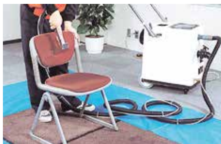
オフィス家具清掃イメージ (現物なければデータ支給)