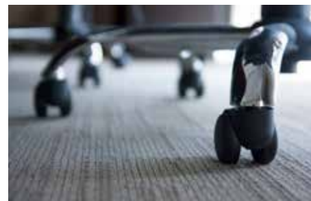
キャスターのイメージ