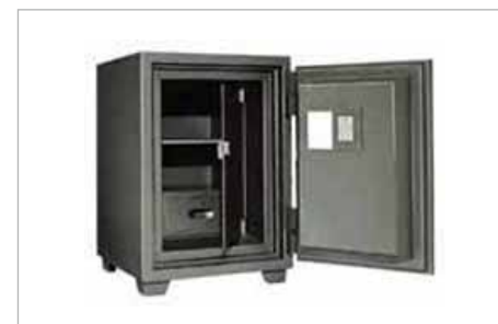
金庫のイメージ (現物なければデータ支給)