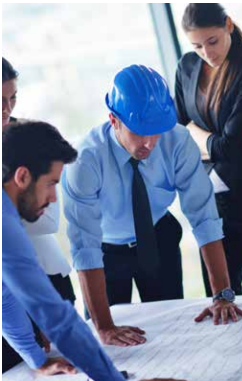
施工管理職イメージ