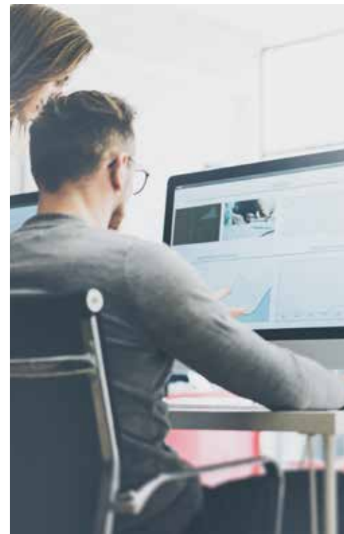
デザイナー職イメージ