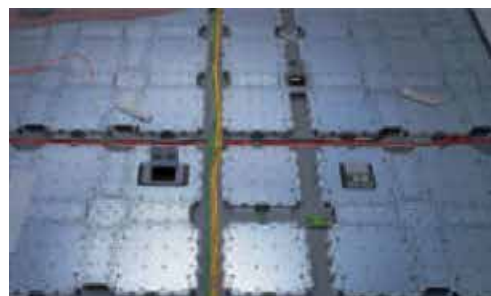
配線を隠す床(壁)のイメージ (現物なければデータ支給)