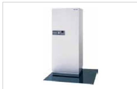
金庫のイメージ (現物なければデータ支給)