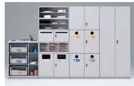
分別ゴミ箱のイメージ (現物なければデータ支給)