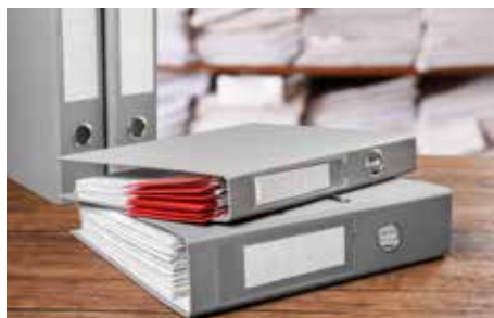
書類整理のイメージ